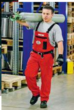
Bild 8 Säcke und Stahlflaschen werden am besten auf den Schultern getragen – mit gestrecktem Rücken!

Praktische Anleitungen zum richtigen Heben und Tragen werden von den Rückenschulen der Schweizerischen Rheumaliga und von spezialisierten Physiotherapeuten und -therapeutinnen angeboten.