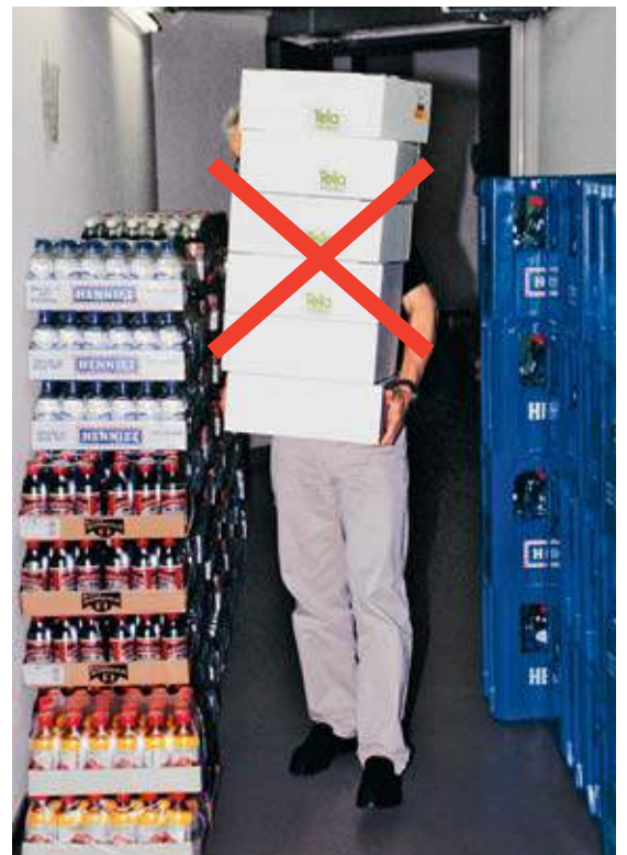
Bild 12 Oft werden Pakete aufeinander gestapelt und versperren die Sicht. Wenn es dann im «Blindflug» noch Treppen rauf und runter geht, wird's gefährlich. Also: Auf gute Sicht achten!