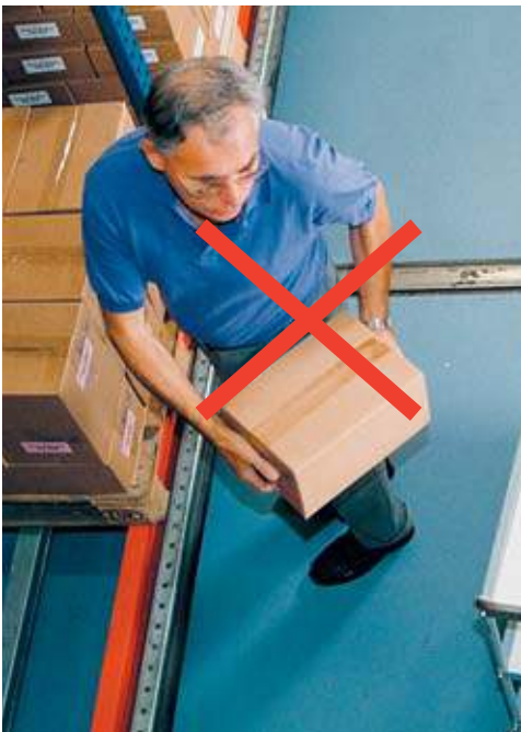
Bild 10 Beim Anheben und Abstellen der Last ist unbedingt das gefährliche Verdrehen des Oberkörpers zu vermeiden.