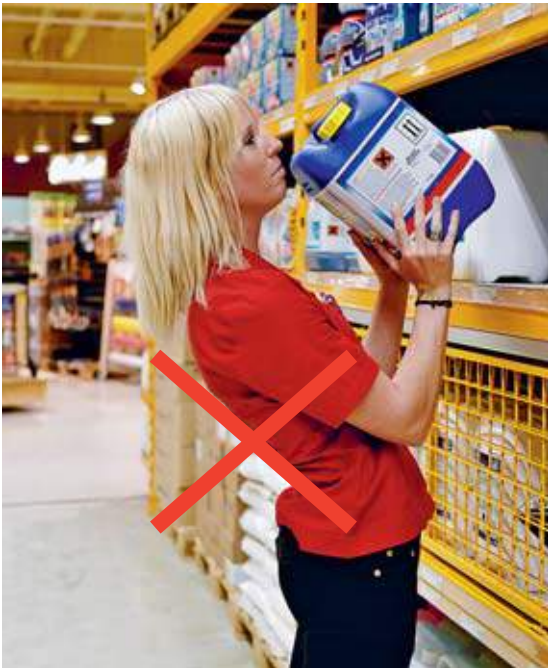
Bild 9 Hohlkreuz vermeiden. Die Tendenz dazu besteht vor allem, wenn die Ablagefläche hoch ist (Steighilfe benutzen).