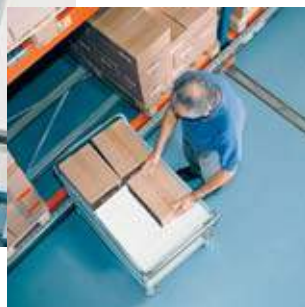
Bild 11 Machen Sie beim Umladen von Lasten von einer Seite auf die andere immer einen Zwischenschritt.