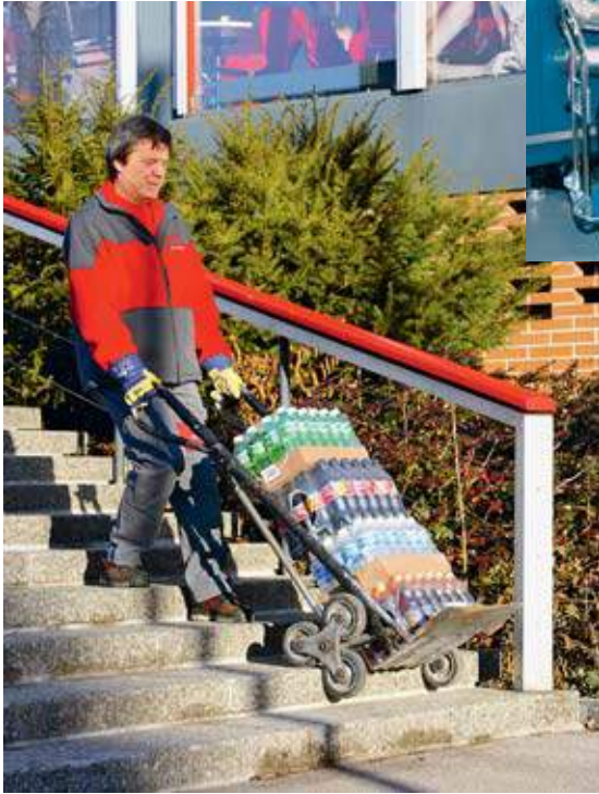
Bild 13 Hilfsmittel einsetzen! Zum Beispiel einen praktischen Treppenkarren ...