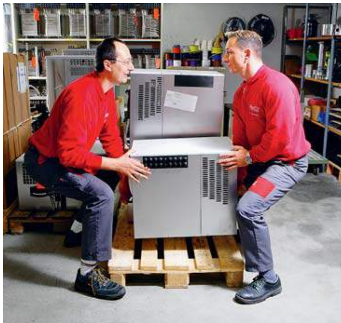
Bild 15 Zu zweit geht's besser.

Bild 16 Auf langen Transportwegen können scheinbar leichte Gewichte ganz schön schwer werden! Deshalb sind bei langen Wegen immer Abstriche beim Gewicht zu machen. Muss man beispielsweise eine Last 20 m weit tragen, nimmt man nur noch die Hälfte dessen, was man sich sonst auf einer Kurzdistanz von 2 m zugemutet hätte. Lässt sich die Last nicht teilen, so sollten Sie ein Transporthilfsmittel benutzen.