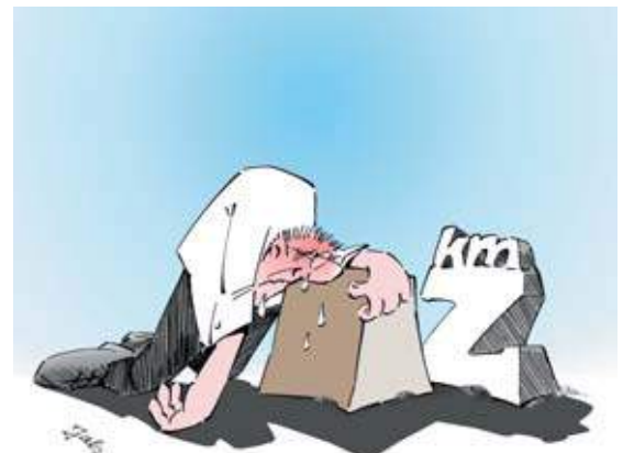
Bild 16 Auf langen Transportwegen können scheinbar leichte Gewichte ganz schön schwer werden! Deshalb sind bei langen Wegen immer Abstriche beim Gewicht zu machen. Muss man beispielsweise eine Last 20 m weit tragen, nimmt man nur noch die Hälfte dessen, was man sich sonst auf einer Kurzdistanz von 2 m zugemutet hätte. Lässt sich die Last nicht teilen, so sollten Sie ein Transporthilfsmittel benutzen.