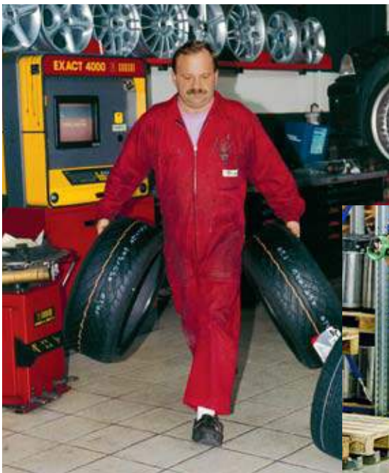
Bild 7 Last wenn immer möglich gleichmässig verteilen.

Auch für das Absetzen von Lasten gilt: In die Knie gehen und Rücken gerade halten!