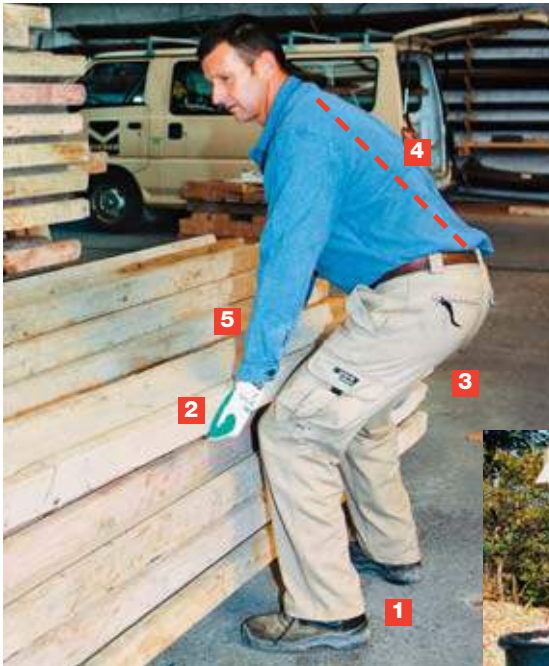
Bild 5 Richtig heben. Das gilt am Arbeitsplatz ...